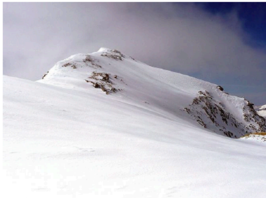
Elwertätsch Auteur Inconnu Source Lötschental Tourismus